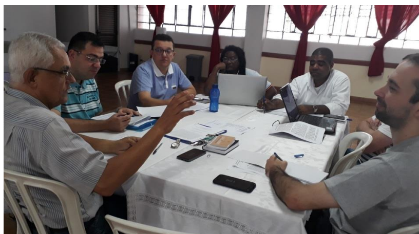
Conselho de Formação