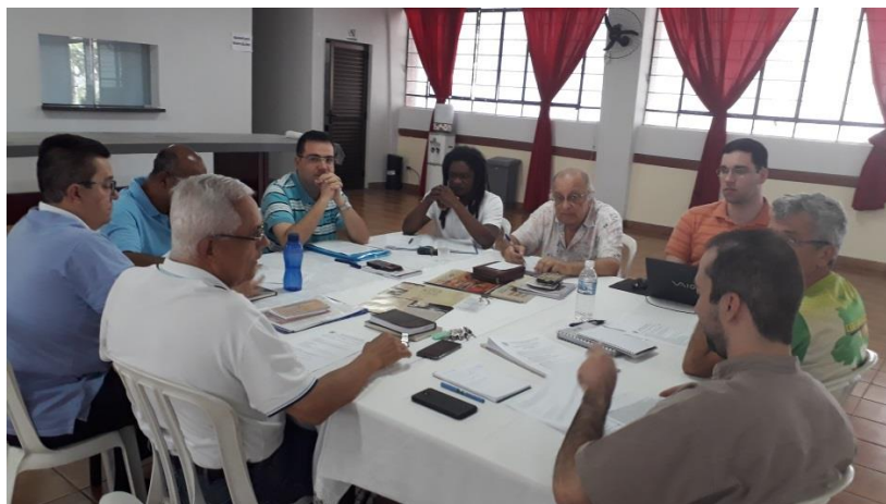
Conselho da Província